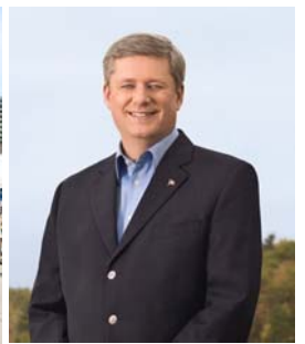
左图：法国巴黎学员庆祝法轮大法日；中图：加拿大多伦多学员庆祝法轮大法日；右图：加拿大总理哈珀