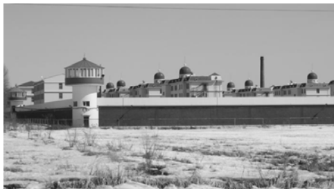
图：佳木斯监狱，这座外观酷似城堡的建筑里，到底隐藏着怎样的罪恶