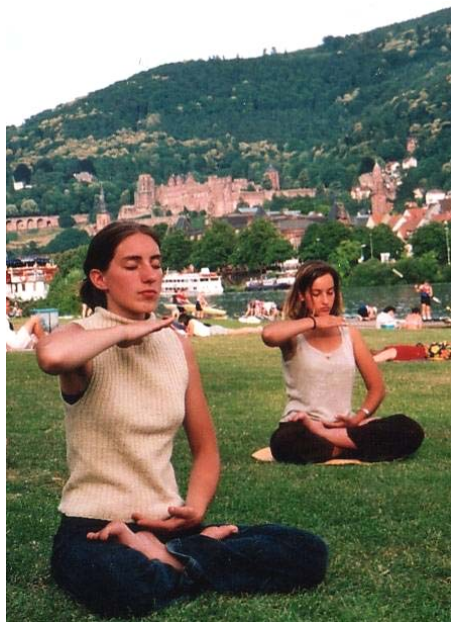
图:德国姐妹炼法轮功第五套功法

近年来,很多研究都显示静坐对健康的益处。其实这一点早已被广大法轮功修炼者证实。当然,真正达到这一点,只通过打坐是不够的,更主要的是要提高自己的心性,指导法轮功学员提高心性的是李洪志先生的《转法轮》等著作。◇