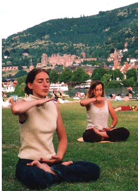
图:德国姐妹炼法轮功第五套功法

近年来,很多研究都显示静坐对健康的益处。其实这一点早已被广大法轮功修炼者证实。当然,真正达到这一点,只通过打坐是不够的,更主要的是要提高自己的心性,指导法轮功学员提高心性的是李洪志先生的《转法轮》等著作。◇