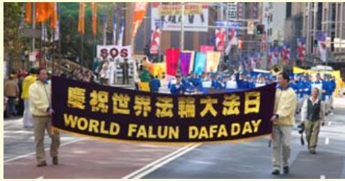
图：五月十四日，澳洲各地法轮功学员聚集悉尼，怀着感恩的心情庆祝第十二届“世界法轮大法日”，并恭贺师尊六十华诞，政要及社区团体代表们纷纷发言表示支持和庆贺。