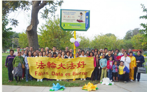
图：五月十三日下午，秘鲁法轮功学员们在专门设置的“炼功固定标示牌”下合影，并欢庆法轮大法日。

【明慧网】二零一一年五月十三日是法轮大法弘传十九周年暨第十二届世界法轮大法日，也是法轮功创始人李洪志先生六十华诞。美洲、欧洲、澳洲、东南亚、香港、台湾等地超过三十多个国家和地区的不同族裔的法轮功学员及其支持者，从五月八日就开始举行各种形式与规模不等的庆祝活动。