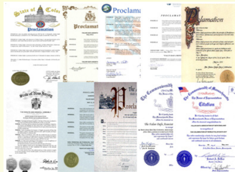
图：美国、加拿大部分政要颁发褒奖，宣布法轮大法日，赞颂“真、善、忍”

在这一普天同庆的日子里，许多国家政要等发贺信、到现场祝贺。每年的五月，都是加拿大庆祝法轮大法弘传世界的月份。今天五月，加拿大总理、多位联邦部长、省及市政要再次给法轮大法学会发出贺信。总理哈