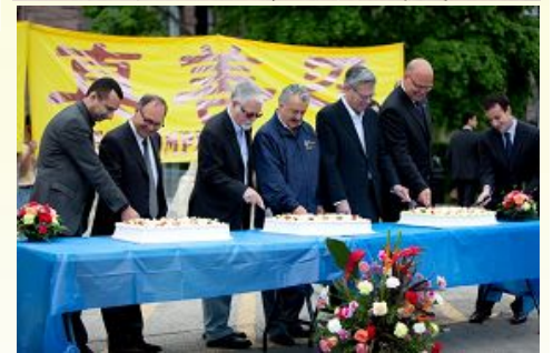
图：二零一一年五月二十二日，一千多名加拿大法轮功学员及支持者在加拿大安省议会大楼前举行大型集会游行，庆祝法轮大法传世十九周年。加拿大自然资源部部长欧利弗（右三）等七名政要到场表示祝贺。

一一年五月十三日为奥尔巴尼市的世界法轮大法日。佛罗里达州特拉哈西市、多拉市、密苏里州奥法伦市等六个城市都宣告二零一一年五月十三日为该市“法轮大法日”。纽约州众议员史蒂文森亲自给法轮功学员送来褒奖，并在演讲前后分别用中文连喊两句“法轮大法好”，史蒂文森说：“我不只是在后面支持你们，而且是走到前面，来支持你们。我们希望看到法轮功团体更加强大。”