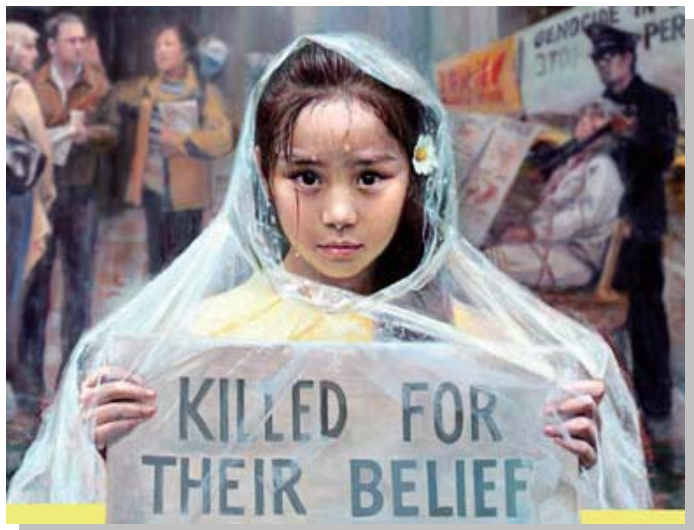
真善忍国际美展作品：《纯真的呼唤》

为了呼吁世人对中共残酷迫害法轮功的关注，法轮功学员在纽约曼哈顿长期以酷刑展、发传单和举展板的方式讲述迫害真相。画中的小女孩在雨中向世人发出纯真的呼唤，希望更多人知道真相，从而唤起人们的良知，帮助早日停止迫害。