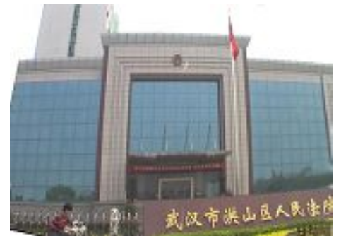
武汉市洪山区法院

另据明慧报道，五月三十一日上午，有四位法轮功学员在法庭外被绑架，据说已被关押到武昌杨园洗脑班。详细情况有待知情者披露。