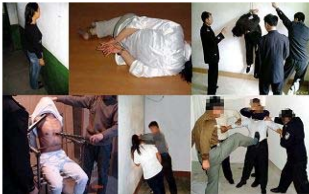
演示图:湖北省洗脑班的种种酷刑

中国人自古就知道“善恶有报”是天理。看看历史,你想想,迫害好人的人有几个有好下场的。病魔不会无故缠身,灾祸也不会无故降临,你不为自己想,也要为自己的家人和子孙后代着想吧!立即停止对法轮功学员的迫害,善待法轮功学员,将功赎罪吧!