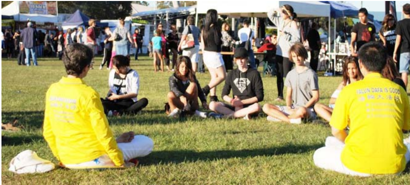
图：一群年轻人向法轮功学员学习功法

（明慧记者布里斯本报道）法轮功是什么？为何全球有这么多人修炼？哪里有炼功点？二零一一年六月四日，澳洲布里斯本北区惹米尔多元文化节庆典上，许多人都在问着相同的问题。