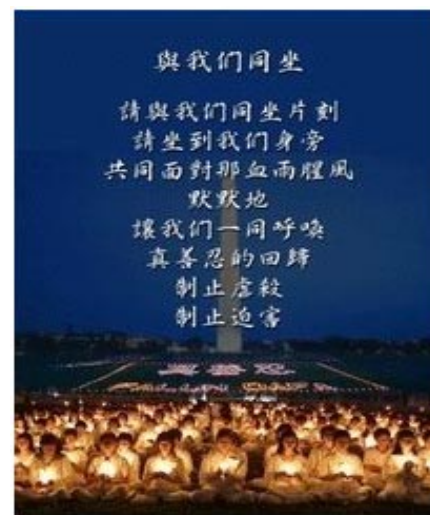
来自全球三十多个国家的法轮功学员在美国华府烛光追悼被中共虐杀的中国大陆法轮功学员