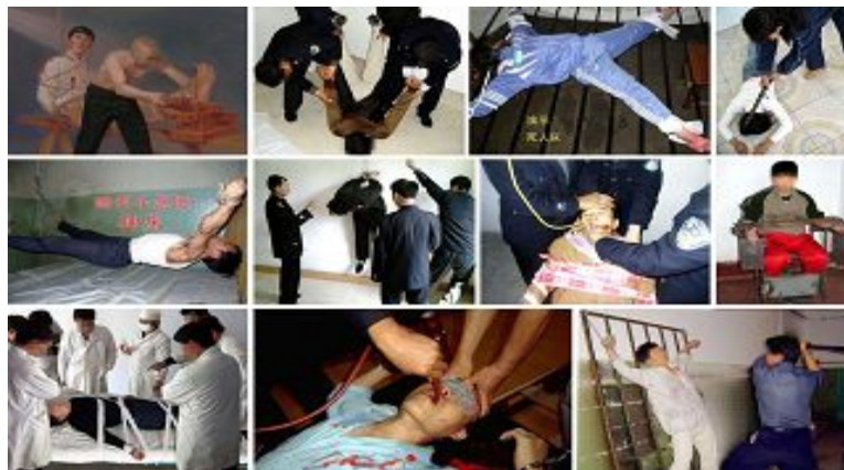
中共迫害法轮功学员已经持续了近十二年,所使用酷刑至少达 40 种以上,令人发指的迫害时时刻刻都在中华大地上发生着。

马三家劳教所三大队大队长是张环、张卓慧也参与了迫害。在此之前的二零一零年五月中旬,张卓慧和张环就把大连法轮功学员梁宇送到东岗楼迫害一个星期,她们用电棍等各种酷刑。当时,北方的天气还很凉,尤其晚间,更显得阴冷,而梁宇只穿单衣单裤单鞋,警察不但让梁