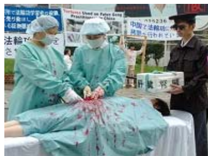
日本法轮功学员曝光中共活摘法轮功学员器官的罪行

2009年11月,西班牙国家法庭做出决定:以“群体灭绝罪”及“酷刑罪”,起诉江泽民、罗干、薄熙来、贾庆林、吴官正五名迫害法轮功的中共元凶。◇