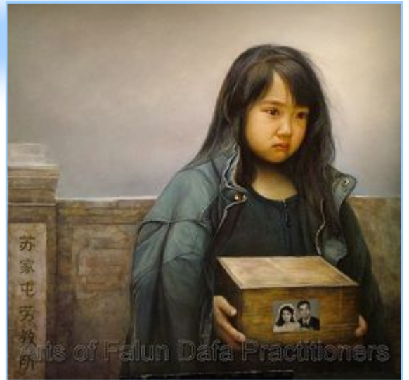
■董锡强，《孤儿泪》，油画（2006年）