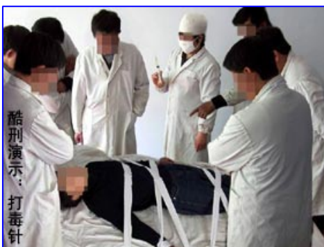
酷刑演示：打毒针（注射不明药物）

但是第二次绝食出现了一个怪现象, 在他被迫输液时, 他感觉全身不舒服, 烦躁不安, 如果哪一天停