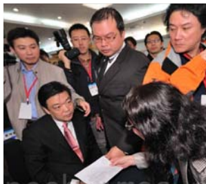
图:中共北京副市长吉林在数百人的会场上,对递到眼前的诉状一脸愕然

吉林: 积极参与迫害法轮功的中共北京副市长吉林,2010年12月13日抵台,15日在台中与新竹两地亲自接获刑事诉状