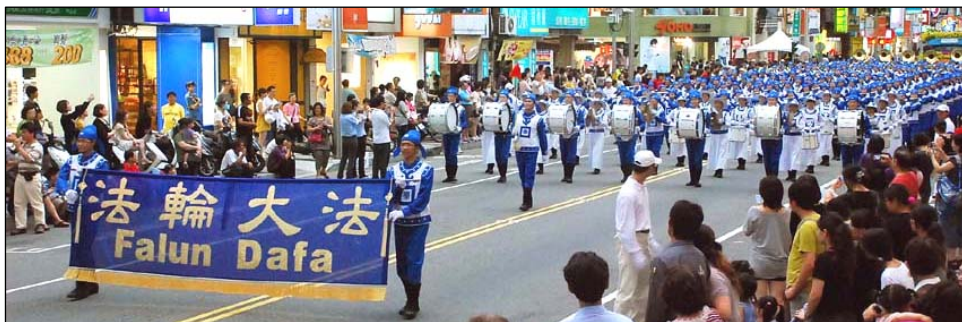
图：二百人组成的台湾天国乐团应邀在“世界管乐年会”系列活动中演出

因揭露中共活摘器官人权暴行而获得二零一零年诺贝尔和平奖提名的大卫·乔高与大卫·麦塔斯在台停留期间，巡回各地举办研讨会，引发台湾各界对中共活摘器官暴行的高度关切与广泛讨论。◇