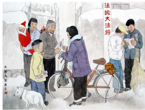
绘画：《历尽千辛传真相 大法福音救世人》