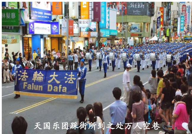
天国乐团踩街所到之处万人空巷

游行踩街队伍从中山路出发，经过吴凤北路、民族路，再走过启明路、体育路，终点是嘉义市体育场。天国乐团经过的路段几乎万人空巷，许多人甚至站到椅子上争取为乐团拍照的机会。