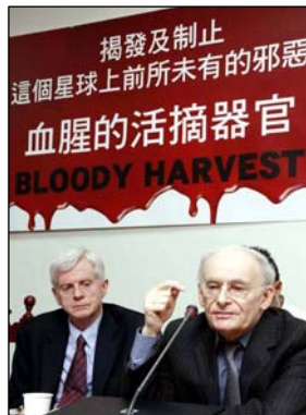
图: 六月二十八日, 大卫·麦塔斯和大卫·乔高在发布会上。