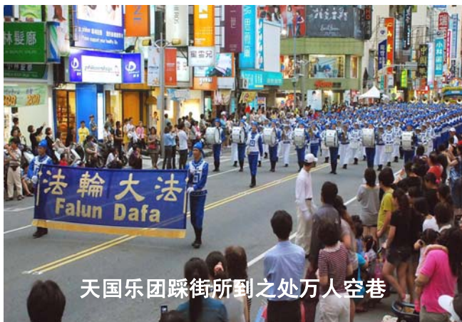
天国乐团踩街所到之处万人空巷

游行踩街队伍从中山路出发，经过吴凤北路、民族路，再走过启明路、体育路，终点是嘉义市体育场。天国乐团经过的路段几乎万人空巷，许多人甚至站到椅子上争取为乐团拍照的机会。◇