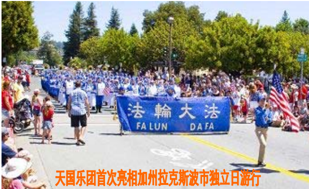
天国乐团首次亮相加州拉克斯波市独立日游行

【明慧网二零一一年七月五日】（明慧记者王英、李若云旧金山湾区拉克斯波市报导）二零一一年七月四日，旧金山湾区法轮功学员首次参加加州拉克斯波市（Larkspur）独立日庆祝活动，北加州法轮大法天国乐团加入了游行队伍。游行组织者里本斯表示，天国乐团是超级的军乐团，希望明年还能邀请到他们来参加。