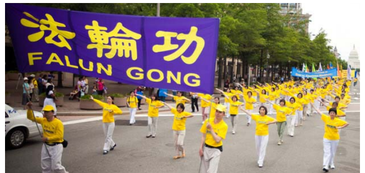
图为在二零一一年七月十五日中午，来自世界各地的二千五百名法轮功学员在美国首都华盛顿 DC 的宾夕法尼亚大道上举行盛大游行中的演示法轮功功法方阵。