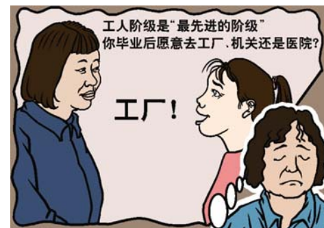
下岗失业之后的痛苦回忆

史是以暴力和谎言支撑，每次的运动都是以谎言开路，再加上暴力迫害。所以说中共的历史是一部举世无双的骗人记录。所以说，中共让中国人唱‘红歌’那真是在为骗子唱“皇帝的新装”。以所谓“九十周年”为借口掩盖历史的真相和十二年对善良的法轮功学员迫害的罪行，历史的见证，怎么会被几首红歌就瞒天过海呢？（文／大陆法轮功学员）◇