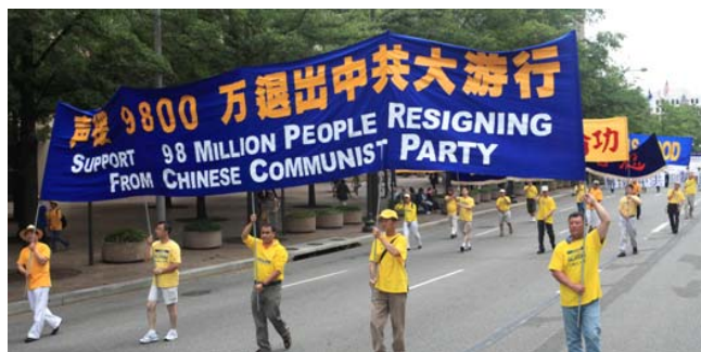
▲ 二零一一年七月十五日中午，来自世界各地的二千五百名法轮功学员在美国华盛顿DC举行“解体中共 停止迫害法轮功”的大游行和集会。声援中国民众退出中共，呼吁各界共同制止迫害。

■ 《九评共产党》一书真实深刻揭露了中共谎言和暴政，已在中国促成一项史无前例的强大的退出中共恶党的精神觉醒运动，至2011年7月19日，已有9892万中国人顺应天意，声明“三退”（退出党、团、队）。