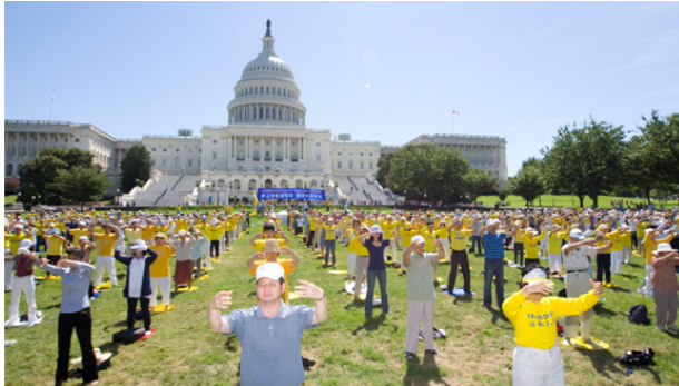
图：七月十四日早上，来自世界各地的法轮功学员汇聚在美国华府国会山，以集体炼功（左图）拉开了将持续三天呼吁世界制止中共迫害法轮功的系列活动的序幕。

（明慧记者 苏青、黄凯莉 美国华盛顿 DC 报道）自从一九九九年七月二十日，中共开始残酷迫害法轮功，每年的七月，世界各地的法轮功学员都会来到美国首都华盛顿 DC，在美国国会山举行呼吁制止迫害的活动，至今已经十二年。今年，二零一一年七月十四日，来自世界各地的法轮功学员再次来到美国华府的国会山，继续呼吁各界关注并制止中共对法轮功的残酷迫害。美国多位国会议员、非政府机构、自由之家、大赦国际等组织的代表纷纷到场表示声援。他们表示，美国政府应该引领世界各国，对迫害发出谴责。