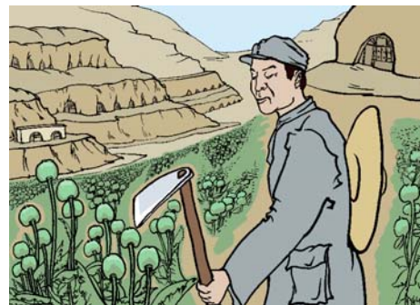
中共的延安大生产运动，种植罂粟，制造鸦片

中共为维持摇摇欲坠的暴政统治，不惜花费纳税人的钱大肆举办唱红歌活动，实质是对中国人的精神摧残和洗脑。红歌是共产党文化，不是中华民族的传统文化，不可能对中华民族文化起传承作用。唱红歌也只是中共的回光返照而已。中共的历