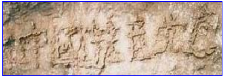
■贵州平塘县掌布乡桃坡村掌布河谷发现了有2.7亿年的“藏字石”，巨石断面内惊现六个大字“中国共产党亡”

2004年11月18日，《大纪元时报》开始发表系列社论《九评共产党》，揭露了中共几十年暴政血腥史，翻开历史中共“土改”、“三反”、“五反”、“镇反”、“肃反”、“反右”、“大跃进”、“文革”、“六四”、“迫害法轮功”，在历次运动中被无辜迫害死