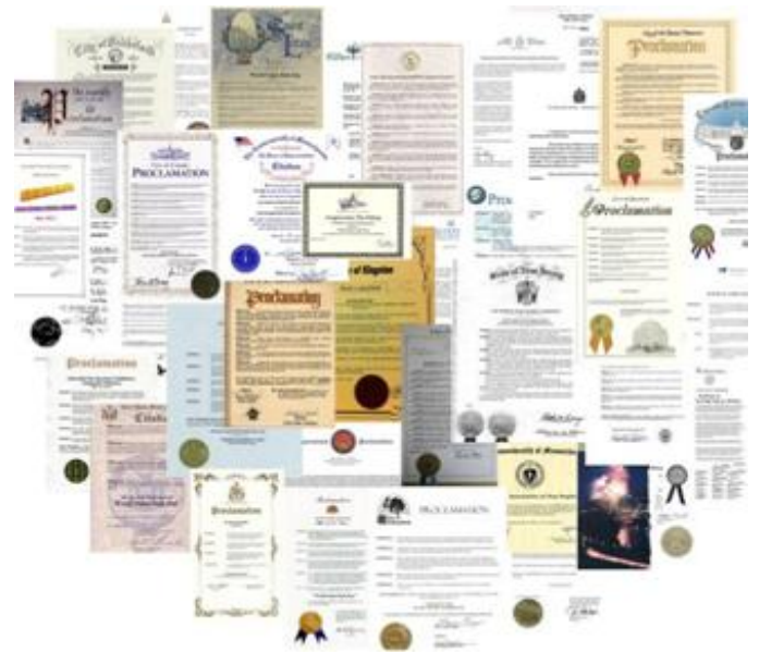
图：2011 年 4 月至 5 月，美国、加拿大多个州、市褒奖法轮大法（图为部分褒奖状）

一一年七月十五日)各界颁与的各类褒奖(包括奖状、奖杯、奖牌、奖旗等)合计一千六百八十四个，通过支援的决议案共三百一十四项，支援信函累计一千一百五十四封。◇