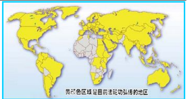
图：黄颜色区域是目前法轮功弘传的地区

近年来国际社会鉴于李洪志师父和法轮大法对人类身心健康作出的杰出贡献，纷纷颁发各项褒奖。迄今(二零