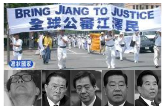
西班牙法庭以群体灭绝罪起诉江泽民

江××这个政治流氓已经恶贯满盈，任何一个生命造下的罪孽，都不会一死了之。江死后，除了在人间永远受到民众的唾骂，在地狱也将永远地痛苦偿还其滔天的罪恶。所有有正义感的人们都应该欢庆这个凶残无耻的邪恶之徒的灭亡。(文/飞鸣)