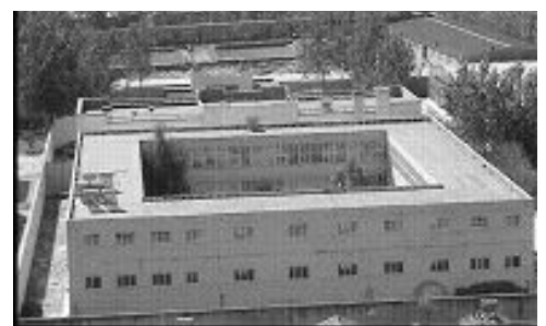
洗脑班后视图（一层是拘留所，二层是洗脑班）