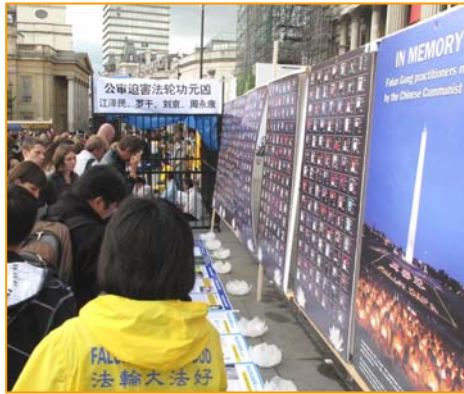
图：2011 年 7 月 16 日，英国伦敦鸽子广场，人们被法轮功真相吸引。

亲身受益的法轮功学员自然希望更多的人也能象他们一样受益。他们在修炼前，面临的困扰其实也是现代社会的人们普遍面对的问题。金钱买不来健康，地位也带不来幸福感和安全感，相反，一味追求金钱和地位，一味的追求物质和感官上的满足，却