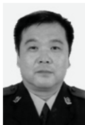
瑞昌市公安局 局长李九萍

（明慧网通讯员江西报道）日前在江西瑞昌市被绑架的六名九江市法轮功学员，有一人已出狱回家，其他五人被分别非法关押在九江市看守所和瑞昌市看守所。