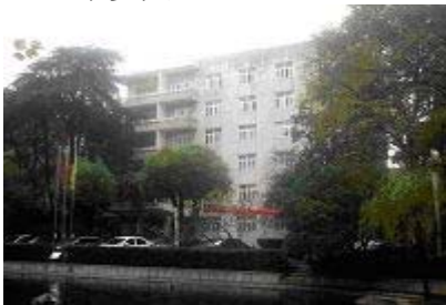
现在的华中科技大学一号楼

华中科技大学为阻止该校法轮功学员到北京上访，于一九九九年十二月二十二日不顾学校国际国内名誉，将八位法轮功学员关入设在一号楼（华中科技大学招待所）的大铁笼，非法囚禁。二零零一年三月，在中共两会之前，又将二十人锁入该铁笼子长达二十多天。