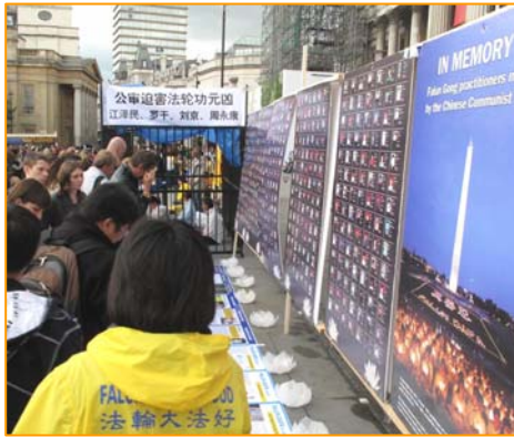
图：2011年7月16日，英国伦敦鸽子广场，人们被法轮功真相吸引。

亲身受益的法轮功学员自然希望更多的人也能象他们一样受益。他们在修炼前，面临的困扰其实也是现代社会的人们普遍面对的问题。金钱买不来健康，地位也带不来幸福感和安全感，相反，一味追求金钱和地位，一味的追求物质和感官上的满足，却