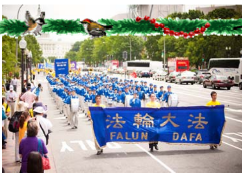
二零一一年七月十五日中午, 来自欧、美、亚、澳等地的二千五百名法轮功学员在美国首都华盛顿 DC 举行大游行和集会, 呼吁各界共同制止中共对法轮功的迫害。