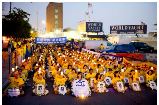
二零一一年七月二十日黄昏美国大纽约法轮功学员在中领馆前举行烛光夜悼，抗议中共对法轮功长达十二年的残酷迫害。