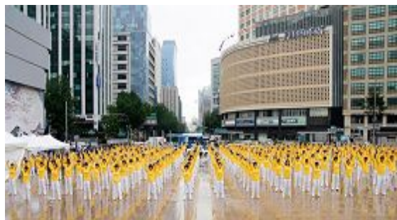
二零一一年七月十六日，韩国八大市民团体与法轮功学员冒雨在首尔广场举行联合集会，谴责中共对法轮功长达十二年的人权迫害。