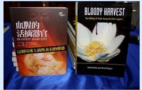
《血腥的活摘器官》中文版和英文版

左图：大卫·麦塔斯是著名人权律师，曾在二零零七年获得加拿大律师协会颁发的年度人权奖，二零零八年一月获得了加拿大马尼托巴省律师协会颁发的二零零八年杰出服务奖，二零零八年十二月三十日，获加拿大总督颁发的平民最高荣誉——加拿大勋章（Order of Canada）。