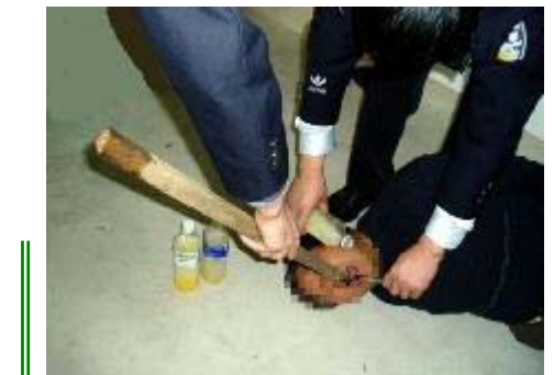
酷刑演示：野蛮灌食

我给他们一家人都做了“三退”（退出中共党团队），那天他看到我，关心的对我说要加小心，问我有没有书，我以为他要真相资料，就给他一本小册子。看到我兜子里还有，他就又要一本不同内容的，告诉我他想看大法书，问我能不能帮他找一本，我答应帮他忙。临走，一再嘱咐我要小心，其实这个警察就是我在被非法关押期间认识的。