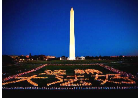
2011年7月15日晚, 来自世界各地的法轮功学员在美国华盛顿纪念碑前, 举行烛光悼念活动。

相对抗暴力与谎言, 用坚忍不屈的精神超越了苦难, 最终得到了世界范围的正义支持。2010年, 美国国会通过第605号决议案, 要求中共立即停止迫害法轮功。今年7月13日, 美国参议院两党提出制止迫害的美国参议院232决议案。