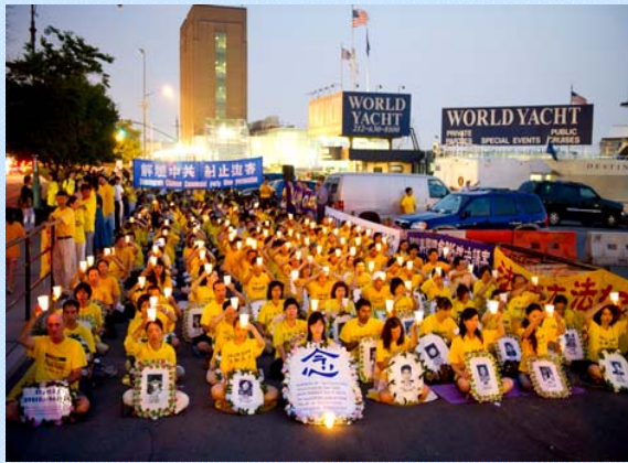
法轮功学员在纽约中领馆前举行烛光夜悼