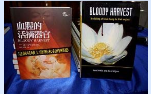
《血腥的活摘器官》中文版和英文版

左图：大卫·麦塔斯是著名人权律师，曾在二零零七年获得加拿大律师协会颁发的年度人权奖，二零零八年一月获得了加拿大马尼托巴省律师协会颁发的二零零八年杰出服务奖，二零零八年十二月三十日，获加拿大总督颁发的平民最高荣誉——加拿大勋章（Order of Canada）。