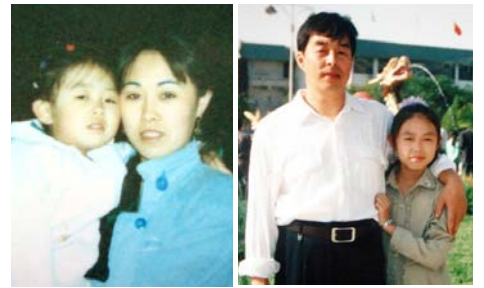
图：孙敏和女儿 图：武阳和女儿

在世界各国，江泽民、罗干、刘京、周永康、薄熙来、曾庆红、吴官正、贾庆林、李岚清等多名参与迫害法轮功的中共高官被以群体灭绝罪、酷刑罪、反人类罪告上法庭。迄今为止遍及五大洲三十多个国家，数十个中共官员被起诉，案件达五十多起。◇