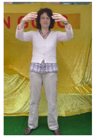
佩特拉展示第二套功法