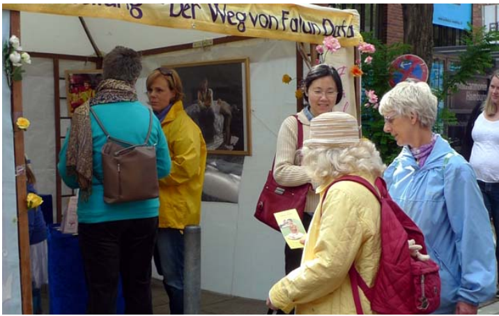
法轮功学员参加德国阿尔托纳文化节