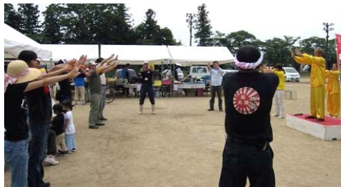
图：民众现场学炼法轮功