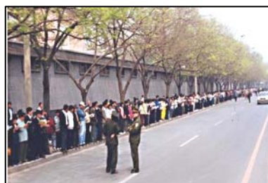
图：1999年4月25日，上万法轮功学员和平上访，向当局反映法轮功的真实情况和刚刚发生在天津的公安暴力抓捕法轮功学员事件。整个上访过程秩序良好，交通井然。离开后地上无一片纸屑，连警察扔的烟头都被他们清扫干净了。有警察感慨地说：“看，这就是德！”