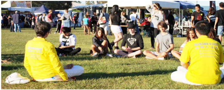
年轻人现场学炼法轮功

(明慧记者布里斯本报道) 法轮功是什么? 为何全球有这么多人修炼? 哪里有炼功点? 二零一一年六月四日, 澳洲布里斯本北区惹米尔多元文化节庆典上, 许多人都在问着相同的问题。