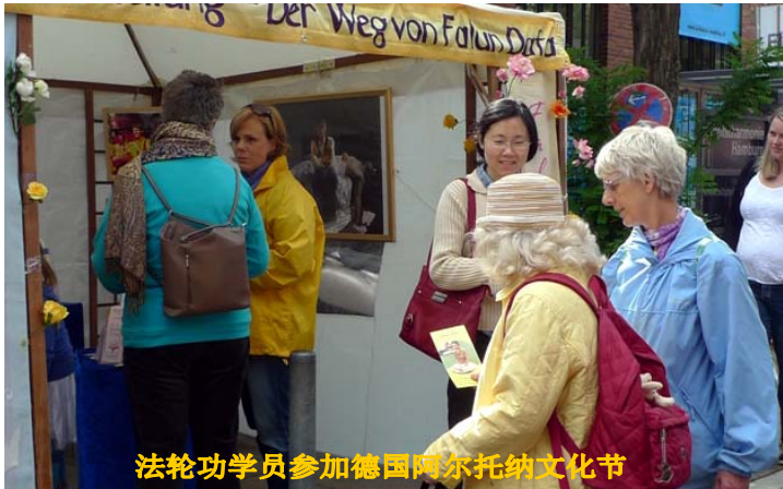
法轮功学员参加德国阿尔托纳文化节