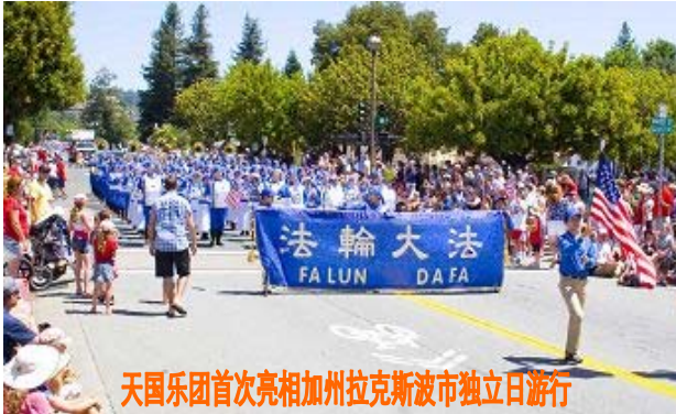
天国乐团首次亮相加州拉克斯波市独立日游行

【明慧网二零一一年七月五日】 (明慧记者王英、李若云旧金山湾区拉克斯波市报导)二零一一年七月四日，旧金山湾区法轮功学员首次参加加州拉克斯波市(Larkspur)