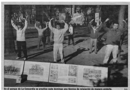
图: 瓦德拉哈勒最大报纸《Nueva Alcarria》对法轮功炼功点的报道图片

的修炼功法,基本原则是:真、善、忍;同时有五套功法,虽然动作简单,但能量场非常强大。