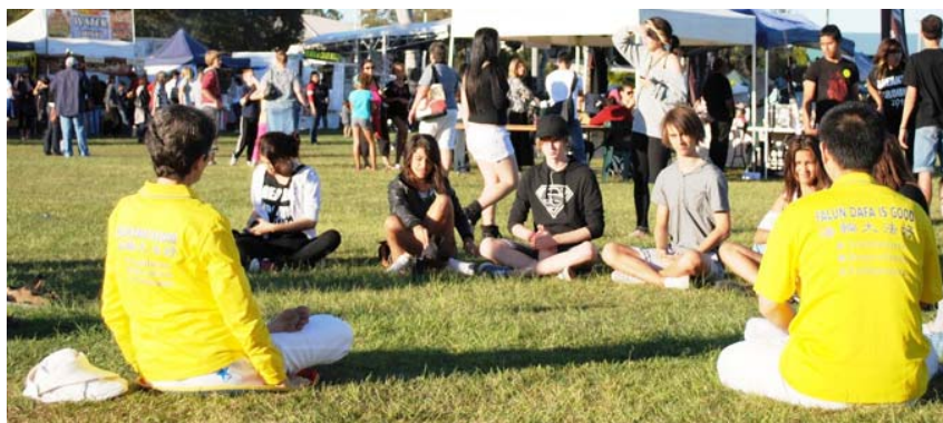
图：一群年轻人向法轮功学员学习功法

（明慧记者布里斯本报道）法轮功是什么？为何全球有这么多人修炼？哪里有炼功点？二零一一年六月四日，澳洲布里斯本北区惹米尔多元文化节庆典上，许多人都在问着相同的问题。