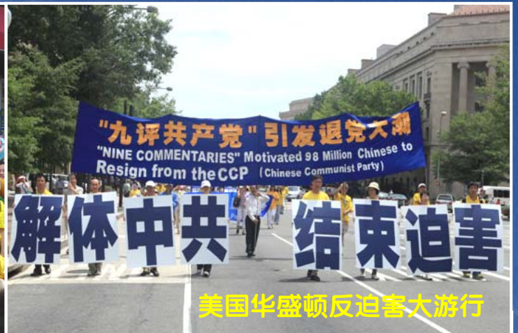
美国华盛顿反迫害大游行