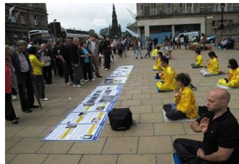
爱丁堡国际艺术节上展示法轮功功法

身着印有中英文“法轮大法好”的黄色体恤衫和金色炼功服的法轮功学员在繁忙街头的出现，成为爱丁堡国际艺术节上一道亮丽的风景。不同国家、不同文化背景的人有缘在爱丁堡走近法轮功、了解到法轮功真相。◇