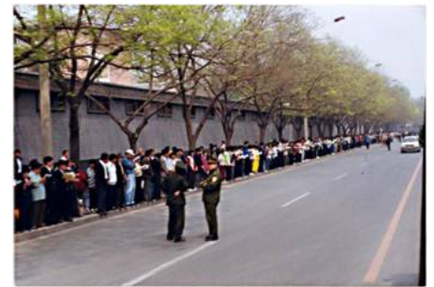
图：1999 年 4 月 25 日，上万法轮功学员和平上访，向当局反映法轮功的真实情况和刚刚发生在天津的公安暴力抓捕法轮功学员事件。整个上访过程秩序井然。离开后地上无一片纸屑，连警察扔的烟头都被他们清扫干净了。有警察感慨地说：“看，这就是德！”