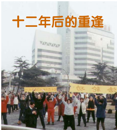
一九九九年一月二日，美国、瑞士、瑞典、芬兰等国大法弟子与大连大法弟子在中国大连集体炼功的场景。

一名来自丹麦的学员。她谈起这段经历激动地说：“那时我刚刚学法轮功，就觉得法轮功和其它气功不一样，所阐述的都是让人怎么成为一个好人的道理，道理简单明了，人生中的很多疑问都在书中找到了答案。炼功更是让我感到身心放松。去中国到北京和大连交流那是我第一次，非常难忘。记得到大连的时候，那里的学员非常热情，一些年纪大的大连学员居然用英文背诵《论语》（《转法轮》一书开篇的短文），这让西方学员感到非常亲切，同时也让我这个中国人感到非常惊讶，那么大岁数，居然在背诵，用的还是英语。”