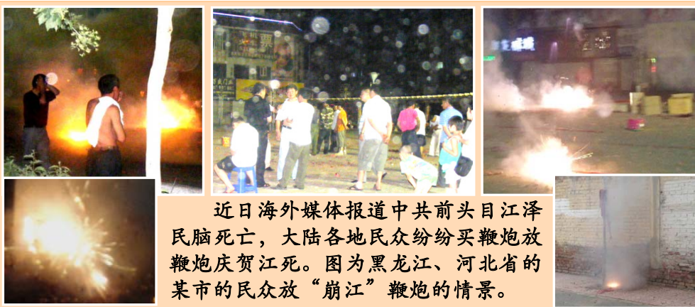
近日海外媒体报道中共前头目江泽民脑死亡，大陆各地民众纷纷买鞭炮放鞭炮庆贺江死。图为黑龙江、河北省的某市的民众放“崩江”鞭炮的情景。