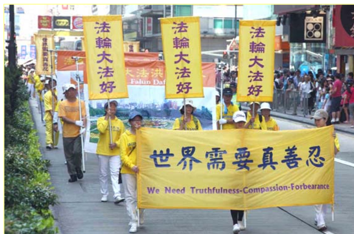
图：香港法轮功学员反迫害十二年集会盛大的游行队伍。

【明慧网】二零一一年七月二十四日，香港法轮功学员及支持团体举行各界声援法轮功反迫害十二年集会游行，呼吁解体中共，停止迫害，并声援九千九百万中华儿女退出中共组织。多位议员及知名人士在会上发言，谴责中共的残酷迫害，表明坚信正义必胜，呼吁各界携手制止中共对法轮功反的迫害。