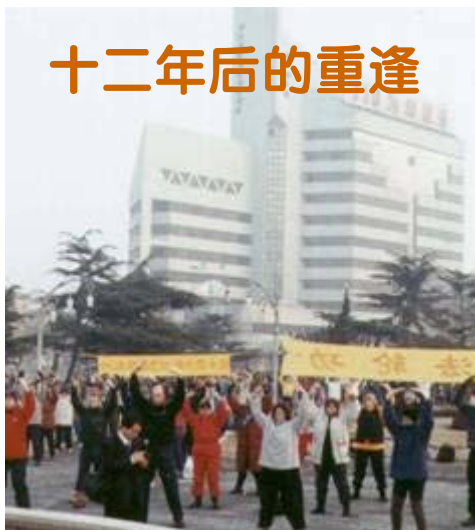
一九九九年一月二日，美国、瑞士、瑞典、芬兰等国大法弟子与大连大法弟子在中国大连集体炼功的场景。

一名来自丹麦的学员。她谈起这段经历激动地说：“那时我刚刚学法轮功，就觉得法轮功和其它气功不一样，所阐述的都是让人怎么成为一个好人的道理，道理简单明了，人生中的很多疑问都在书中找到了答案。炼功更是让我感到身心放松。去中国到北京和大连交流那是我第一次，非常难忘。记得到大连的时候，那里的学员非常热情，一些年纪大的大连学员居然用英文背诵《论语》（《转法轮》一书开篇的短文），这让西方学员感到非常亲切，同时也让我这个中国人感到非常惊讶，那么大岁数，居然在背诵，用的还是英语。”