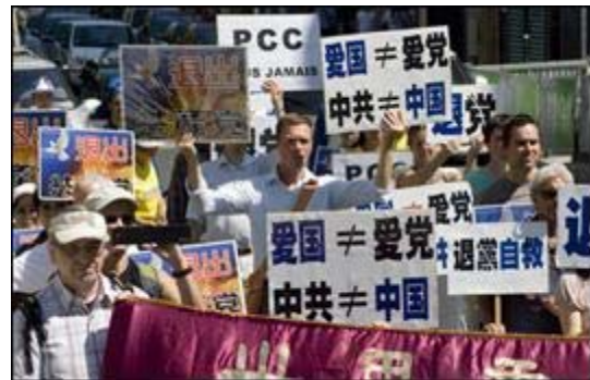
巴黎大游行，声援一亿多中国人三退

法好”、“声援一亿勇士退出中共党、团、队”等大横幅在阳光下闪光，手持横幅的人们脸上带着善良的笑意。声势浩大的游行队伍吸引了很多华人，一直站在街头，并仔细阅读收到的真相资料。