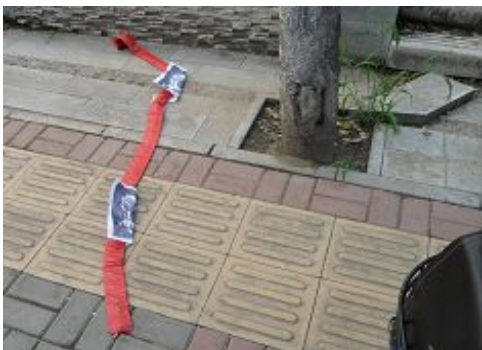
在一个公园便道上看到的,未燃放的鞭炮上放着江泽民的照片,这是炮蹦前的准备。

【明慧网】江泽民死亡(或即将死亡)的消息传来,为了驱逐江魔头的邪灵和欢庆江的死亡,中国大陆到处可见民众燃放鞭炮的情景。这是一组在河北某城市看到的市民燃放鞭炮的照片。