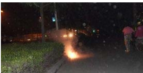
晚上经常看到乘凉的居民在便道上燃放的鞭炮。