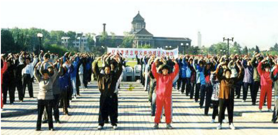
图：一九九八年五月，长春法轮功学员集体炼功。