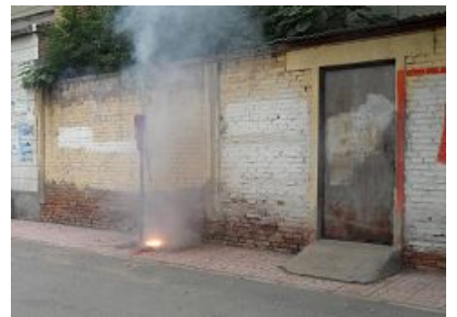
下午4点多在一个小巷里看到的正在燃放的鞭炮。