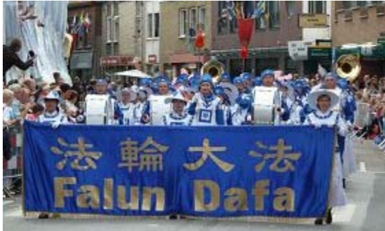
■ 欧洲天国乐团在荷兰尊德尔特市 (Zundert) 节日游行队伍中