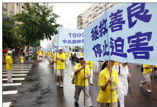
图：台湾法轮大法学会 7 月 17 日在台北举行悼念“7.20”活动——“拯救善良 停止迫害”大游行。

员，如果看到有人抓捕法轮功学员，您可以上前去围观，如果胆子大一点可以站出来，您可以大声地说上一两句公道话。