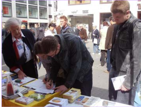
明白真相的人们纷纷签名支持反迫害

一对衣着考究的中年夫妇看过有关活摘器官的真相传单，停下来和学员交谈。他们说，“这个（中共）政权简直太不可思议了。你们是做很