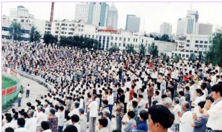
1999年迫害前，哈尔滨3万人在体育场晨炼法轮功功法

新华网为什么要造这样的谣言？中共迫害法轮功已长达12年，12年来中共早已因迫害而声名狼藉，而且它罪恶的本质也越来越被世人看清。此时用这么下流的手段抹黑法轮功，不过就是想继续维持迫害，并借此恐吓中国老百姓而已。中共一方面用一言堂的喉舌媒体炮制谎言，诬陷教人向善的法轮功，一方面封锁明慧网等法轮功的网站，阻止大陆民众接触法轮功书籍，足见其流氓本性。◇