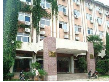
图:淮南市六一零在安徽理工大学宾馆(理工大家属区院内)办洗脑班迫害民众。