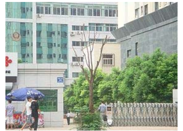
图:淮南市国家安全局(淮南市火车站斜对面 舜耕中路 106 号)。